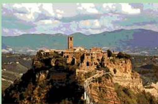
Bagnoregio, tra le città candidate a Capitale della Cultura 2025

ting Institute (think tank fondato da Philip Kotler, Enrico Foglia e Christian Sarkar per diffondere un nuovo approccio al business che porti ad una rigenerazione delle comunità sia a livello sociale che ambientale). La presentazione avverrà giovedì 23 giugno 2022 dalle ore 9:30 alle ore 17 nel corso di un convegno ospitato dalla Luiss University (Aula Magna Pola/Parenzo).